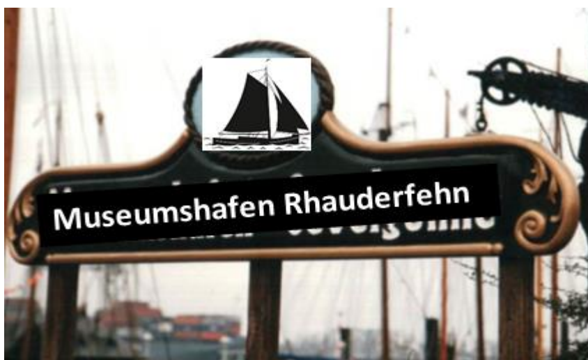
Abbildung 4: Holztafeln mit typischem Fehnsegler