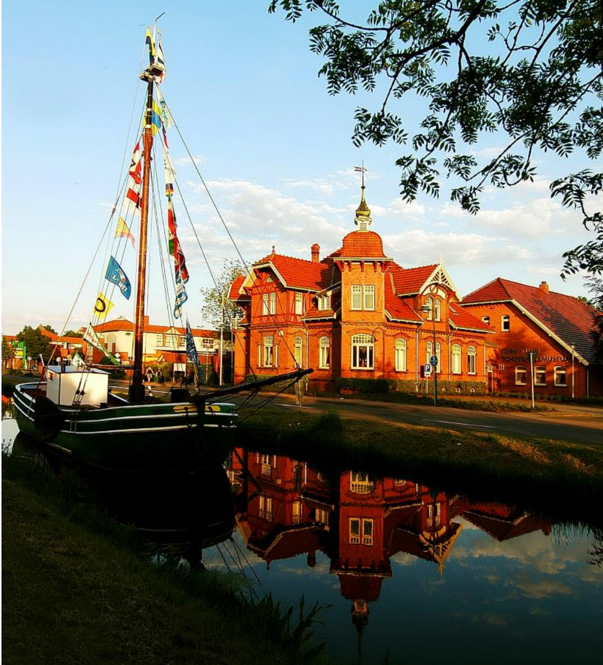
Abbildung 2: Archivbild Engelina vor Museum 2

Dazu unterstütze ich den Heimatverein Overledingerland bei der Suche nach einem Ersatz für die Tjalk Engelina, die sich nun am Anleger zwischen Hoffnungskirche und Fehn-Forum befindet. Der noch leere Liegeplatz vor dem Museum soll mit einem „neuen“ historischen Segelschiff belegt werden. Wo früher die Engelina gelegen hat soll nun ein anderes Schiff das bisherige schöne Landschaftsbild vom Kanal, Museum und Schiff ausfüllen.